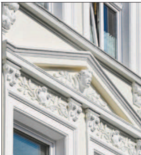
Die Firma Walecki gestaltete die Fassade für das Gebäude der Paderholz GmbH.