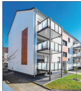
Die Wohnanlage des Spar- und Bauvereins erhält ebenfalls einen Preis.